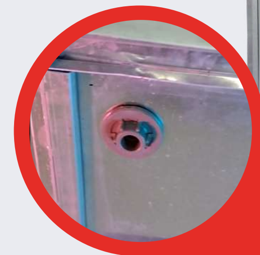
Dreno na base inferior