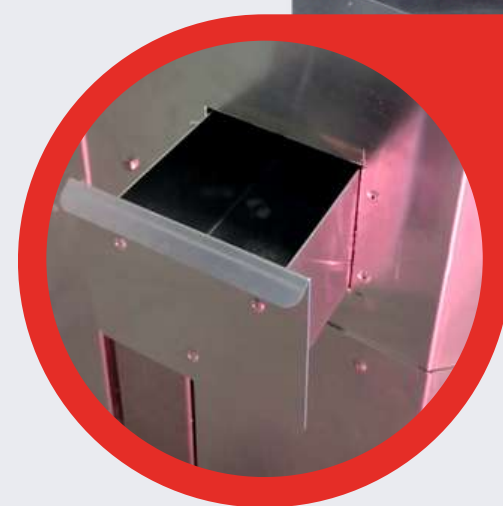
Entrada de água manual